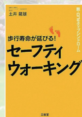
土井氏ご著書 (三省堂)