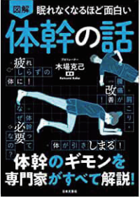
木場氏ご著書(日本文芸社)

木場氏の長年の経験により、「年代も性別も運動能力も問わず誰でもできる!、道具を使わずとも行えるので手軽にできる!、体力やコン