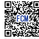
フットコアマイスター制度の詳細はこちら!!

ディジョンに合わせ無理なくできる!、体幹と同時にバランス力も鍛えることができる!」をコンセプトに考案された「KOBA式体幹バランストレーニング(通称:KOBAトレ)」は、現在全国に1700人のライセンス所持者があり、その内「マスター」と呼ばれる170名が、弊社との協同プロジェクトである「フットコアマイスター」ライセンス制度に取り組みんでいます。 豊富な実践を含む動画は近日公開予定。