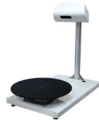
三次元シャーム計測機