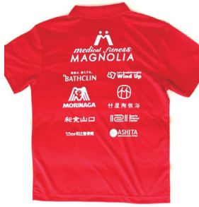
スポンサー/サプライヤーTシャツ 121SSCも入れてもらっています

中野選手は高校の時、ユース世代の日本記録を樹立！現在も高校記録は破られていません！その後、難病と闘いながらも走り幅跳びの先陣を走り、オリンピック出場へ向け、頑張っている選手です。昨年行われた