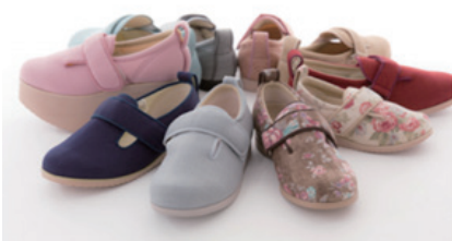
「あゆみシューズ」シリーズの一例

また、セミナー開催当日の開始30分前から、「初めてでも簡単！ Z o o m の使い方」と題したレクチャーを行いますので、これまでZ o o mを利用したオンラインセミナー