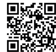
セミナーお申込専用 QR コード