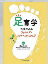
高山氏ご監修 (全日本病院出版会)