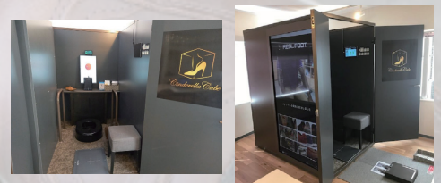
シンデレラキューブの内部(左)と外観(右)