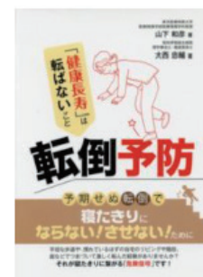
大西氏共著(つちや書店)

2001年 川村義肢株式会社、2006年 医療法人社団シロアム会こたけ整形外科クリニックリハビリテーション室室長、2008年 学校法人神戸滋慶学園神戸医療福祉専門学校三田校 義肢装具士科 専任教員、2012年 伊南行政組合昭和伊南総合病院 地域先進リハビリテーションセンター 主任、国立研究開発法人産業技術総合研究所 外来研究員(～現在)、2019年 九州工業大学大学院生命体工学研究科 博士後期課程修了、2020年 城西国際大学 福祉総合学部 理学療法学科 准教授、大阪大学大学院医学系研究科 招聘教員、2021年 城西国際大学 福祉総合学部 理学療法学科 教授 《社会貢献・学会活動》市中在住脳卒中者への装具ボツリ又ス併用運動療法研究会 世話人(2011年～現在)、義肢装具士協会 代議員(2017年～現在)