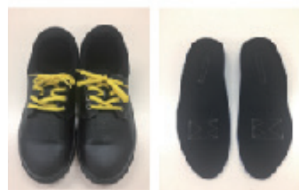
安全靴とフルオーダーインソール

予てより工場などの産業労働環境下における事故原因のうち、従業員の転倒は看過できない課題としてクローズアップされているものでした。そこで、同工場の各部署で働く従業員約100名のモニターを募り、弊社開発システムにより全員の足を計測し、正しいサイズの安全靴にフルオーダーインソールをセットしたものを実際の労働環境下で着用頂き、約1年4カ月に渡る追跡調査を実施、その効果検証方法および分析結果をご報告します。